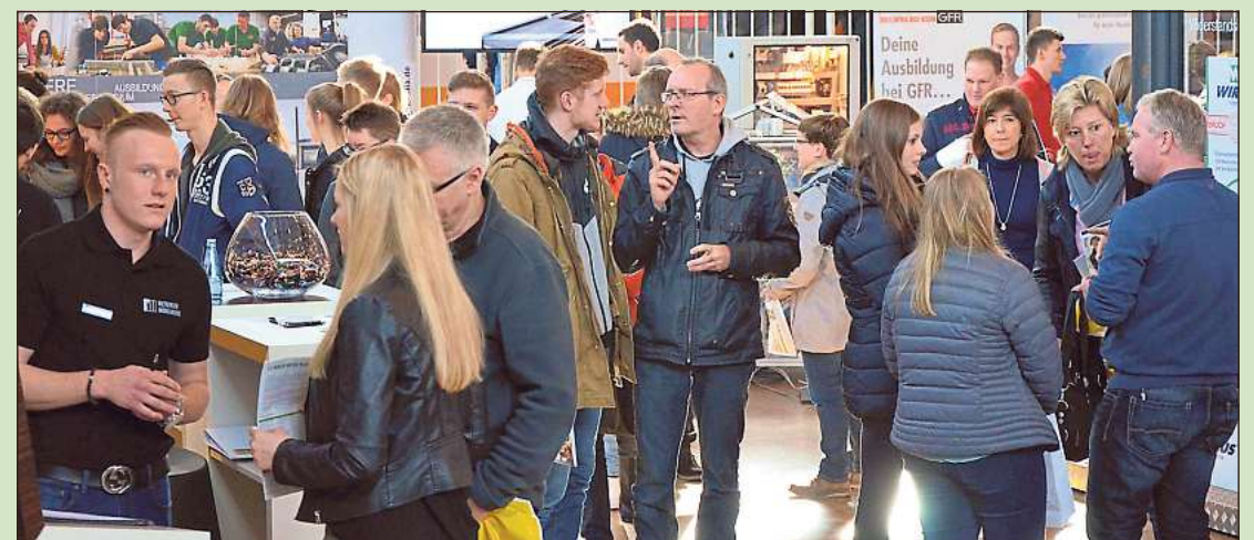
Viele umliegende Schulen haben vorab bereits Plakate und Falblätter erhalten, in denen sich auch Tipps zur Vorbereitung auf die Berufemesse befinden.

lokale Sonderseiten Ihre Ansprechpartnerin vor Ort: