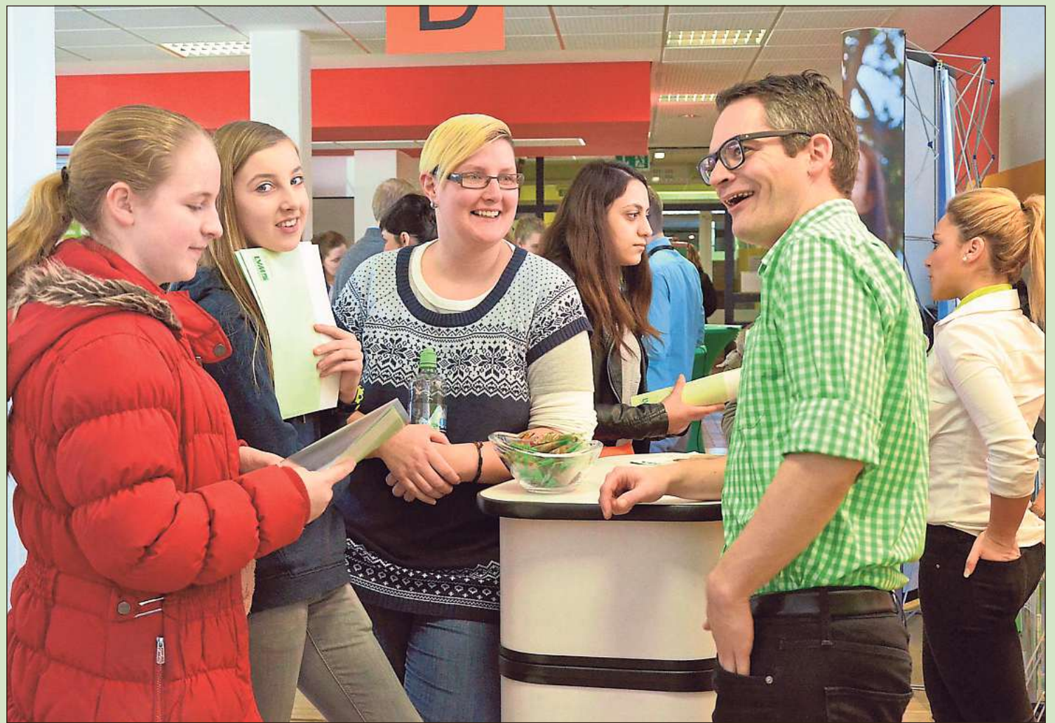
Auf der Seite der mehr als 100 Aussteller sind am kommenden Samstag im Schulzentrum Rietberg erneut „Global Player“ wie Miele, Bertelsmann, Mohn Media, Beckhoff Automation, Claas, Siemens und Hella vertreten.