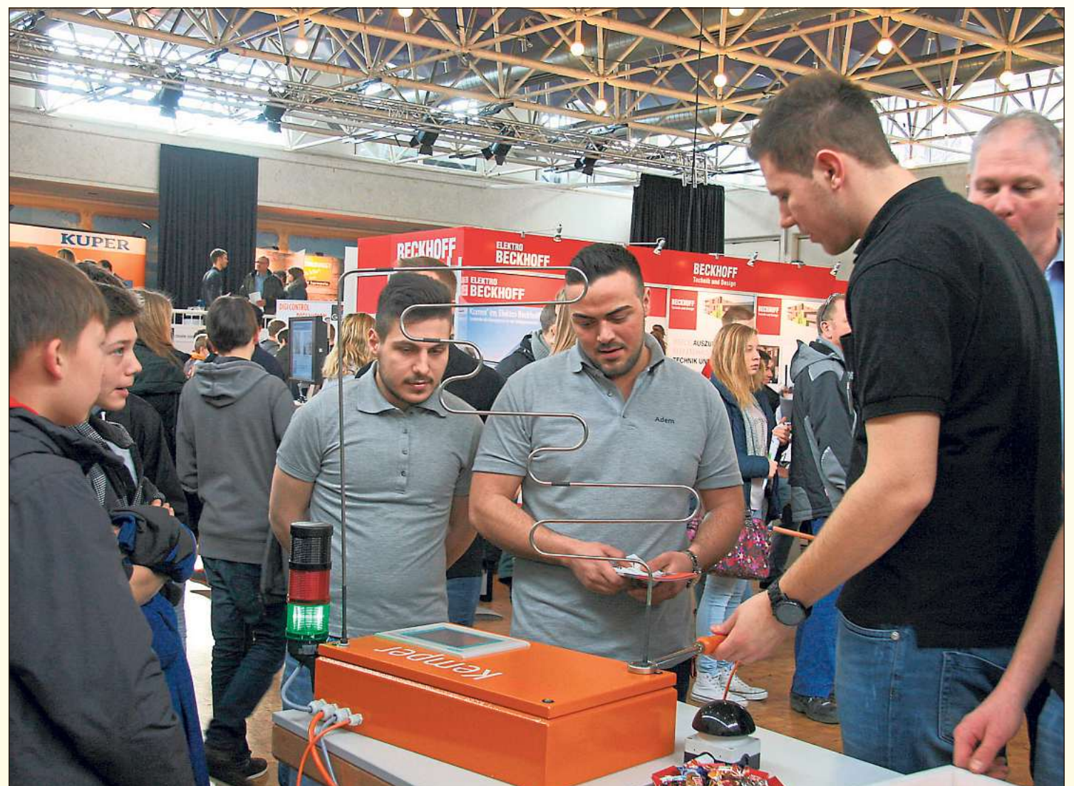
Bei der Berufemesse im Schulzentrum am morgigen Samstag stellen sich Hochschulen und Fachhochschulen, Unternehmen, Öffentlicher Dienst, Kollegschulen und Menschen aus der Praxis von Studium und Beruf interessierten Schülern sowie deren Eltern vor.