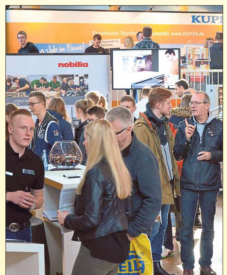
Am Tag der Messe erhalten alle Besucher am Eingang eine nach Branchen sortierte Ausstellerübersicht.